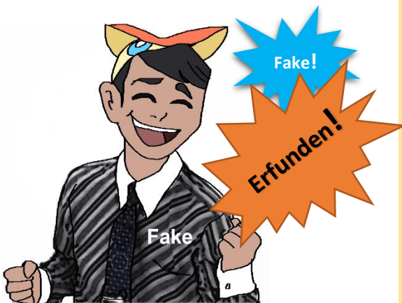
Abb. 1: Drawing by AnJo, no rights reserved ...